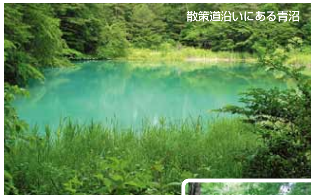
散策道沿いにある青沼

裏磐梯レイクリゾートの向かいに「裏磐梯物産館」より散策道に入ります。 大変平坦で歩きやすいコース です。散策を始めてすぐ「柳沼」があり、静かに水を湛えています。この沼には、フナ、ウグイ、ワカサギが生息しています。柳沼より歩いて約15分、木々の間から青く澄んだ「青沼」が姿を見せています。